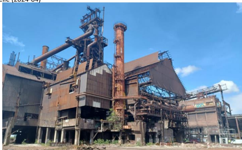
Vue actuelle (2024-04)

Demande du supplémentaire de L'ASBL « Des Racines et des Ailes d'Acier »: Préserver les 2 halles de coulée principales (TC1 TC2)